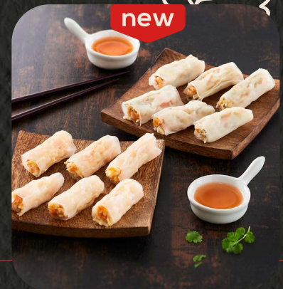
MINI ROULEAUX DE PRINTEMPS 95 918 | Crevette & poulet