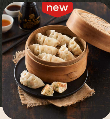
GYOZAS 139 745 | Crevette