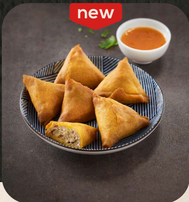
SAMOSSAS 131 004 | Poulet curry coco